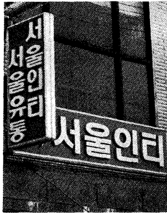
△ 수원사무실 간판

계약농가에게 사료, 병아리 약품 등 원자재를 공급하고 kg당 140원의 사육비를 지급하는 조건으로 닭 1.5kg 중량을 회사가 일괄 수집하여 50%정도는 일반유통업체에 공급하고, 50%는 도계된 닭을 재가공하여 대량 소비처 및 외식업체에 공급하고 있는데 현재 kg당 생산비는 830원대를 유지하며 도계한 후 절단, 가공을 거쳐 외식업체에 kg당 1,750원대에 판매하고 있다.