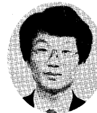
○ 김용화 : 편집차장 (전 편집과장)