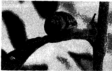
달팽이도 사과나무에 피해를 주는가?(안동)

시대에 과실가해 해충의 피해방지가 주목적이었으나, 현재는 착색을 좋게해서 품질을 향상시켜 수익을 높여보고자 하는것이 더 중요하다. 그렇다고 하더라도 개당 수십원씩의 경비를 들여 봉지를 씌우게 되므로 한 나무에 몇 개씩 일부만 씌우는 것보다는 일정면적 내에 있는 나무전체에 봉지를 씌워 이들 나무에는 심식나방이나 부패병(접무늬썩음병) 농약을 절약하는 것이 좋을 것으로 생각한다.