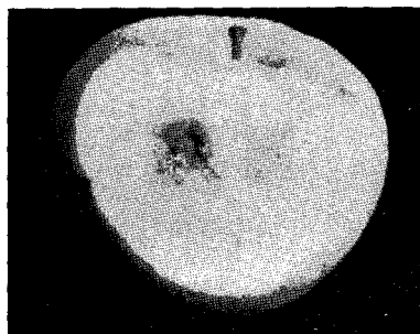
흡수나방류의 피해를 받은 과실내부

사과굴나방은 잎속에서 약 1cm 2 정도의 잎살을 갉아먹는다. 전반적으로 발생은 있었으나 일부 농가에서 8월이후 피해엽율이 70~80% 이상 높고 한 잎당 10개 이상의 피해를 본 경우도 있다. 이외에 과실을 가해하는 복숭아순나방과 복숭아심식나방은 일부 자두나무