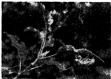
말매미가 탈피해 나온 껍질

농가가 40% 정도에 이르고 있다. 또한 개화기에는 꽃가루를 옮겨줄 방화곤충이 필요한데 농약위주 방제체제로 인하여 꿀벌이나 꽃등애 등이 크게 활동을 못함으로써 2/3 이상의 농민들이 일본에서 사용하기 시작한 “가위벌”을 이용하고자 희망하고 있다. 일부농민이 일본에서 직접 들여와 사용을 시도하고 있으나 여러가지로 검토되어야 할 문제가 있으므로 얼마동안은 사용을 자제해 주는 인내가 필요하다.