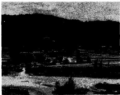
폐교된 국민학교 주변의 사과연구소 부지

금년 초에 “과수원 벌레들의 한해살이 이야기”를 시작하면서는 온 힘을 기울여 과수재배 농민들에게 좀 더 도움이 되는 내용을 다양하게 써 보고자 마음먹었다. 하지만 별로 유익한 이야기도 전해드리지 못하고 벌써 마지막을 장식하려니 많은 아쉬움이 남는다.