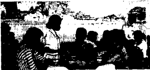
△ 공원의 레스토랑

미얀마에 가면 도회지전 조그만 촌락이전 반드시 눈에 띄이는 것이 있다. 그것은 선반 위에 나란히 놓여