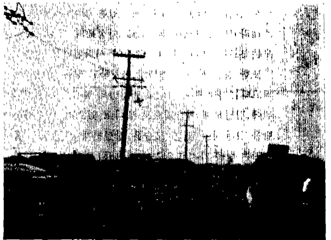
△ 양곤시 외각부락의 배전선로와 공공교통수단

이와 같은 역기능은 우리나라에도 허다하여, 편하고 빨리 목적지에 가려고 만든 자동차가 오히려 목