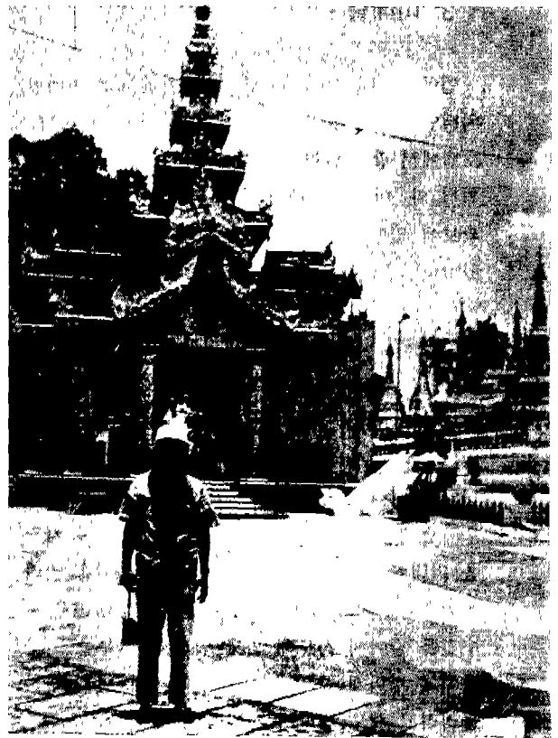
△ 파고다 경내의 필자. 경내에는 맨발이기 때문에 발바닥이 따갑다.

사람들이 여기에 참배하는 모습은 정말로 진지하기 이를데 없었다. 미얀마의 남자는 일생에 한번은 불문에 입적되어야 한다고 한다. 쉐다곤 · 파고다 참배를 위한 입장요금은 외국인은 5달러, 내국인은 33차트이며, 신발과 양말을 벗고 들어가도록 되어 있다.