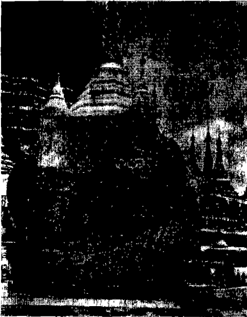
△ 파고다 탑신 내부구조 : 낙뢰로 파손된 탑신을 보존하고 있었다.