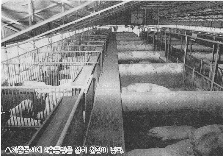
△기존돈사에 2층돈방을 설치 천장이 낮다.

“ 2층 돈방에는 생후 20일령부터 60일령까지 사육하고 60일령이 지나면 바로 밑의 돈방으로 내려 보내게 되어있어 돼지를 이동시키는데 드는 인력을 줄일 수 있게 되어있다.” ”