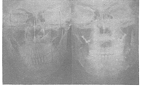
그림 2. 비대칭 안모의 교정 및 외과적 치료.

일반적으로 안모의 비대칭이 발견되는 시기는 10세 이후에서 20세 전후로 하악과두의 성장이 활발한