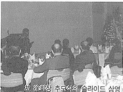
故 徐회장 추모식의 슬라이드 상영