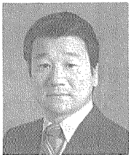
이 시 백