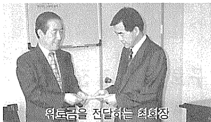
위로금을 전달하는 최회장