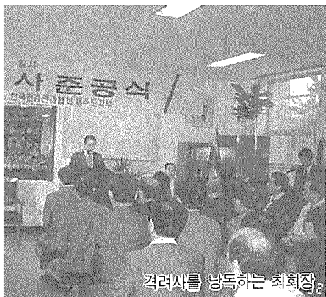
격려사를 낭독하는 최회장.

한국건강관리협회 제주도지부는 지난 8월21일, 신축청사 준공식을 제주시 연동 312-13에 위치한 신축청사에서 가졌다.