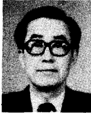
姜 二 根