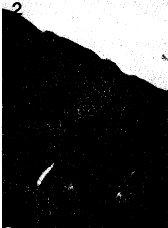
Figure 2. Serial section of Fig. 1. Hematoxylin & Eosin staining. \times 40 .