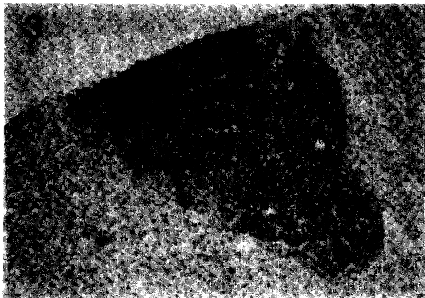
Figure 3. High magnification of GST-P positive foci of Fig. 1. \times 100 .