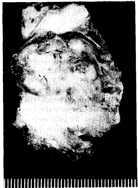
Fig. 4. 육안조직절단면 소견