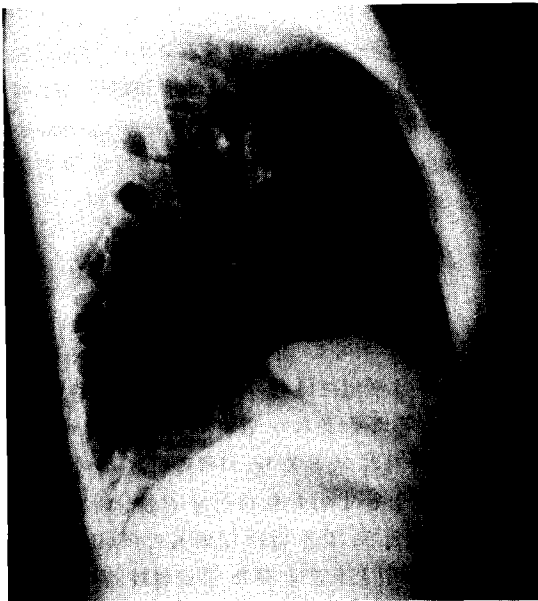
Fig. 2. 측면사진

들어가며 종양의 중앙에 저음영 지역을 동반하는 비교적 균일한 종양소견을 보였으며 종괴에 의한 늑골이나 흉골침식 소견은 보이지 않았다(Fig. 3).