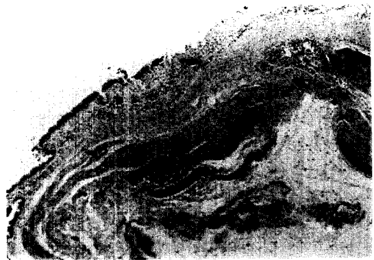
사진 4. 낭종의 조직소견으로 낭종의 벽이 가성섬모를 가진 원추 상피세포를 보이고 있다.

낭종의 진단하에 수술을 시행하였다. 수술소견은 4ICS로 posterolateral incision 한후 aortic knob 뒷쪽 기관벽의 좌측면에 결체조직모양의 뿌리가 붙여있는 4×3×7cm의 기관지성 낭종을 절제했다(사진 3). 조직소견으로 가성섬모를 가진 원추 상피세포, 즉 호흡상피세포로 낭종의 벽이 이루어져 있었고 임파구의 침윤이 있는 소견이 보였으며, 연골도 보였다(사진 4). 술후 12일에 특이증상이나 소견없이 퇴원하였다(사진 5).