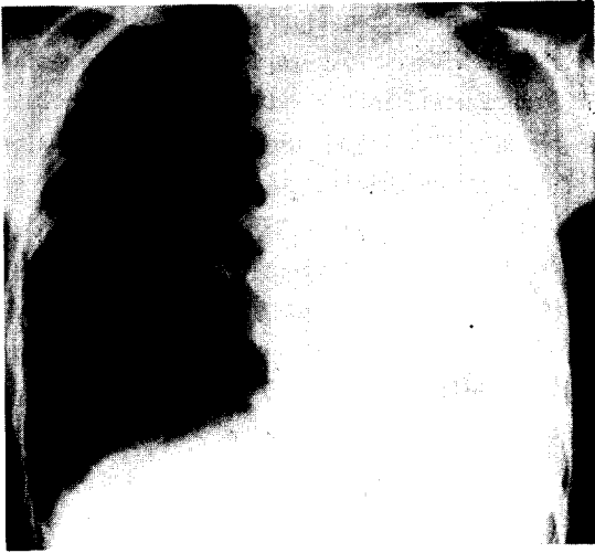
사진 1. 입원 당시 흉부 촬영 사진으로 좌측 전폐의 무기폐 소견을 보이고 있다.