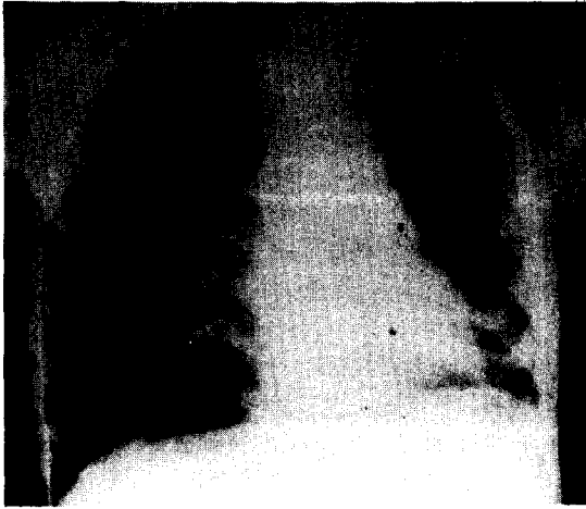
사진 5. 수술후 흉부 X-ray 사진에서 무기폐소견이 사라진 거의 정상소견을 보이고 있다.

심낭, 횡격막, 경부 그리고 복부내에서도 발생될 수 있다 1) . 기관지성 낭종은 태아기에 원시전망(foregut)의 양측에 측벽(lateral septum)이 생겨서 중심부로 발전하여 복부부분(ventral part)은 기관아(tracheal bud)가 되고, 배부분(dorsal part)은 식도로 형성되는데, 이때 원시기관의 이상발아 또는 이상분지로 인해 기관지성 낭종이 생성된다고 한다 2) . 따라서 이들 낭종은 기관지와와의 연결유무 그 세포자체의 분비능력에 따라 액체로 차있을 수도 있고, 공기로 차있을 수도 있게 된다. 기관지 낭종의 발생빈도를 보면 과거에는 비교적 드문 질환으로 알려졌으나, 최근 흉부질환의 진단방법 및 치료법의 발달과 정기 신체검사등으로 인해 증가하는 경향을 보이고 있다. Maier 3) 에 의하면 기관지성 낭종은 대개 폐실질내에 위치하는 수가 있으며, 조격등 기관지성 낭종을 해부학적 위치에 따라 다음과 같이 분류하였다. (1) Paratracheal type (2) Carinal type (3) Hilar type (4) Paraesophageal type (5) 기타 비조직학적으로 기관지성 낭종은 둥근 형태의 얇은벽을 가진 낭종으로 대개 2-10cm의 크기를 갖는다. 일반적으로 단일한 공동(cavity)을 형성하지만 드물게 다발성으로 보일때도 있어 Abell 4) 은 17례의 기관지성 낭종중 3례가, Ringertz 5) 는 21례의 기관지성 낭종중 3례가 다발성으로 발생하였다고 보고 하였다. 기관지성 낭종은 대부분 낭종내 무색 무취의 점액성 액체를 함유하는 경우가 많고 조직학적으로는 거의 모든 예에서 위중층 섬모 원주 상피세포(Pseudostratified