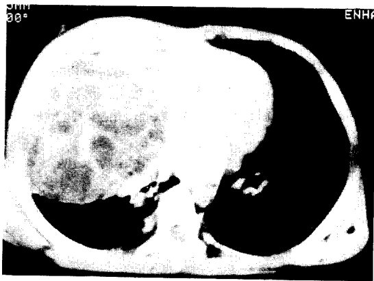
Fig. 2. Inhomogeneous mass in Rt chest. Relatively well margined and No lymphadenopathy.

술전 검사한 CEA, \alpha FP치는 CEA가 3.1\mu\text{g}/\ell 로 정상범위였지만 \alpha FP은 22.5\mu\text{g}/\text{ml} 로 증가되어있어 악성일 가능성이 높은 배세포종으로 진단하고 수술을 시행하였다.