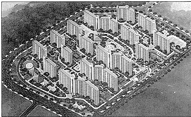
방화지구 5,6단지 조감도

는 이 시점에 외국인들의 국제적인 시각을 통해 자각토록 하기 위해 대한민국의 남북한 사이에 있는 DMZ가 더 이상 필요없게 되는 시점을 향해 Cathleen Crabb을 Director로 백남준씨를 명예의장으로 하고 12명의 집행 위원회와 7명의 편집 위원회로 구성된 조직에 의해 실현되었으며 총 60명의 작가가 참여하여 DMZ 내에서 일어날 수 있는 온갖 이벤트, 아이디어 등을 겨냥하고 국제적인 포럼이자 전시회인 Project DMZ를 통해 이론적 제안을 한 것이다.