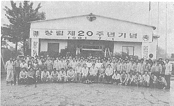
◇ 창립 제20주년 기념행사

평택공장은 7월 10일 사옥 준공식을 갖고 종전 구사옥 조립식 건물을 철거하여 원자재 야적장을 넓히고 신사옥을 지하1층 지상3층으로 건립하여 이사를 하였다. 종업원 후생복지 시설의 일환으로 목욕탕, 강당, 체력단련시설을 설립하여 강당에는 농구대, 탁구대, 배구코트, 배드민트 코트를, 체력단련실에는 종합운동기구, 역기등을 구비하여 종업원의 체력단련과 여가선용을 즐길수