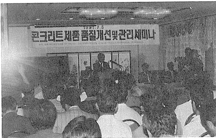
◇ 콘크리트 품질관리 및 개선 세미나 개최

부산·경남지부의 보고에 의하면 태풍 제12호 글래디스에 의한 회원사의 피해액이 1억 2000여만원이라고 한다.