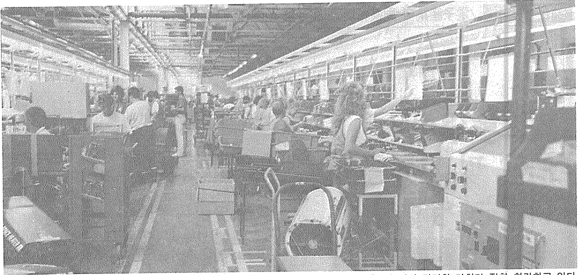
금년 1월 걸프전쟁 이후에도 예상과 달리 달러화 가치가 점차 하락하고 있다.