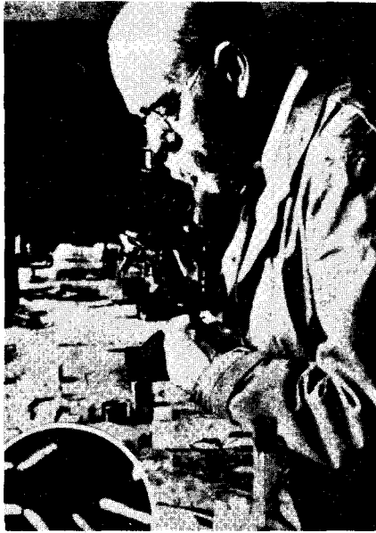
현미경으로 결핵균을 보고있는 로버트 코흐

그의 29회 생일날 아내 Emmy가 생활비를 절약하여 그에게 현미경을 선물하게 된다. Koch는 이 현미경과 마이크로통, 수제 인큐베이터를 갖고 초보적인 형태의 실험실을 만들게 된다.