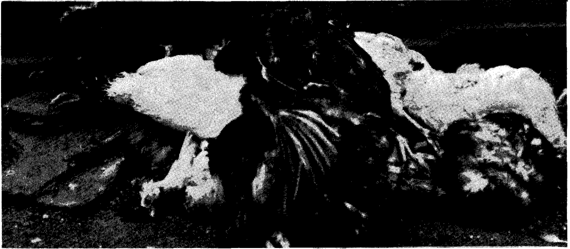
표5. 상대습도와 풍속에 따른 기형발생율