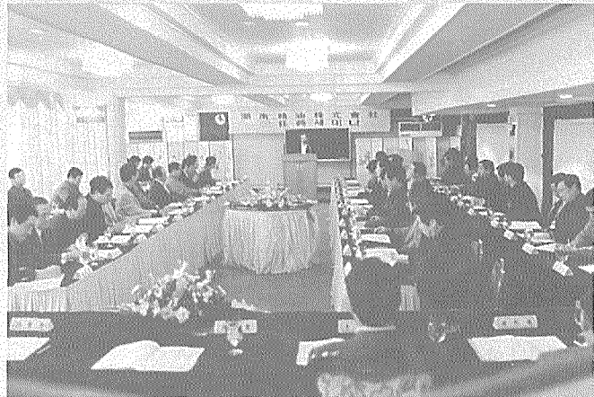
91년도 임원세미나가 10월25, 26일 양일간 湖油 및 방계회사 임원 53명이 참가한 가운데 수안보파크호텔에서 개최되었다.

또한 현재 진행중인 인재개발위원회 활성화 프로젝트와 관련하여, 인재상과 인재개발의 기본방침의 설정, 개발 시스템의 마련으로 인재가 육성되는 것은 아니며 상사가 부하 개개인의 자질과 희망을 파악하여 조직에서 필요로 하는 인재를 육성하기 위해 애정과 노력을 아끼지 않을 것을 당부하였다.