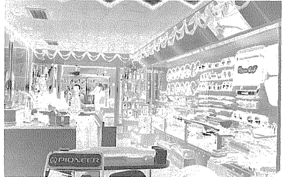
국내 주유소에 도입된 TBA매장의 진열상태 깔끔하고 모던한 스타일이 돋보인다.

세번째로 업종선택이 끝난 후 그 업종에 맞는 시설물의 인테리어 및 상품 진열의 중요성을 충분히 인식해야 한다는 점이다. 가장 기본적인 컨셉트를 고객위주로 하여 고객의 구매능력이나 연령분포 등