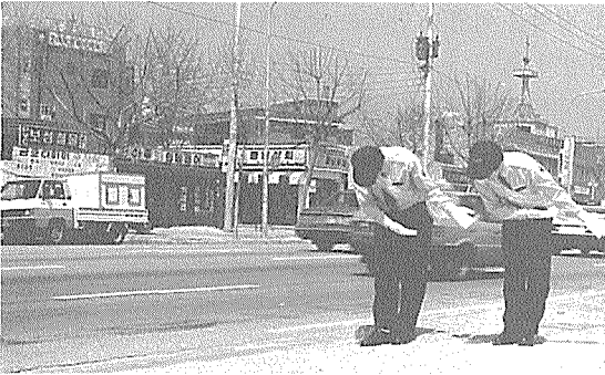
서비스에 대한 시각의 변화는 국내 정유사에서 먼저 출발해 계열 주유소에 파급되는 추세이다.

량에 비례하는 경영소득보다는 신규허가의 억제로 인한 프리미엄현상과 이권화가 된 주유소허가권 등 잘못된 인식으로 소비자에게 비취지고 또한 가장 가치 없는 장소로 손꼽히는 위치에 서게 된 것이다.