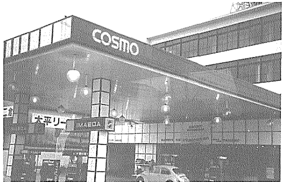
복합건물로서의 기능과 대형화 추세의 대표적인 시라이 코스모 계열 주유소.