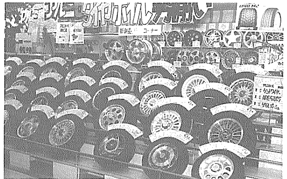
TBA습을 가진 월계열 주유소의 타이어 디스플레이

유류 이외의 수익원 개발이 절대적으로 요구되는 상황에서 그들이 만들어낸 또다른 수익원은 흔히 TBA(타이어 배터리 액세서리)라고 불리는 경정비 및 액세서리 판매였다. 그와 함께 처음에는 고객유치의 한 방법으로 도입했던 무료 세차를 자동세차기의 설치로 유료로 전환시키는 등 수익의 극대화를 위한 경영개발을 꾸준히 추진해 왔다.