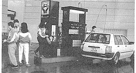
3K의 대표적인 직업으로 꼽히는 일본 주유소에 근무하는 젊은이들 그러나 일단 취업한 후의 직업의식은 놀랄만하다.

이런 여러가지 요인으로 감소추세인 일본의 주유소들은 정부의 규제완화로 커다란 변모를 보이고 있다. 정부는 그간 주유소를 여러가지 제약에 묶어 많은 영업제한을 가했으나 규제완화 정책을 펴 경영난을 완화시켜 주었다. 예를 들어 주유소 택지를 입체화하여 복합건물로의 건축을 가능하게 하고 화기를 취급하는 음식점을 허용하는 등 여러가지 소방법을 완화시킨 것이다. 일련의 완화조치들은 日本의 주유소들에 활로를 열어주어 간선도로변에 대형화 주유소들이 신축되거나 개축돼 월간 200kl 이상을 판매하는 주유소들로 전환하고 있다.