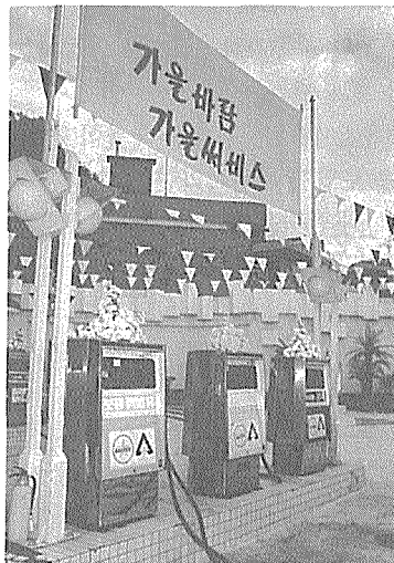
국내에도 주유소마다 독특한 판매활동을 벌여 차별화를 꾀하고 있다. 호남정유 계열 대리점인 동방석유의 가을철 미고객 이벤트

서비스는 크게 시설서비스와 인력서비스로 나눌 수 있다. 먼저 시설서비스의 경우 다양한 기능이 요구되는 다각화로 전환이 필요하다. 지금까지 소비자들이 생각하던 주유소의 이미지를 바꾸우면서 소비자의 욕구를 충족시켜 주는 이종의 효과를 시설서비스를 통해 얻어야 한다.