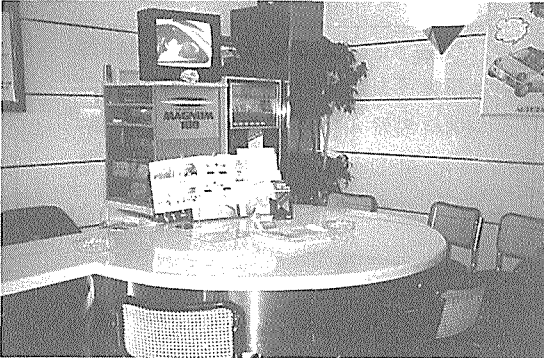
유류고객을 확보하기 위한 전략의 하나로 그들은 휴게실을 중요시설물로 취급한다.

그래서 그들은 지금 유류고객을 끌어 들일 수 있는 방향으로 주유소의 설계나 서비스를 추진해 나간다. 油外상품의 판매공간보다는 서비스공간이나 휴식공간에 더 비중을 두고 있다. 커피자판기 설치나 커피의 무료제공, 휴게실내의 미술품진열 등 아직 우리로서는 받아들여지지 않는 다양한 방법들이 시도된다.