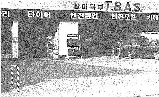
국내에 도입된 TBA로 대도시의 주유소들은 주유와 함께 하는 경영다각화의 일환으로 정비업을 도입했다.

이런 경우의 주유소 TBA는 실패할 확률이 높다. 만약 TBA시스템을 도입할 계획이라면 옆의 경쟁점보다 월등한 시설이나 인력을 확보해 전문점으로서 이미지를 고객에게 심어주어야 한다. 아니면 가장 기본적인 시스템인 윤활유교환이나 타이어체크 등 급유고객에게 서비스라는 기본적인 컨셉트만으로 끝나는 것이 필요하다.