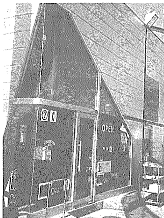
고객을 유인하는 중요 포인트는 건물의 외관. 독특한 디자인이 지니는 이의 호기심을 자극한다.