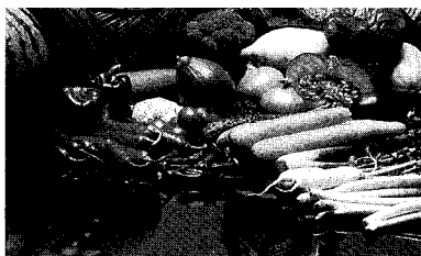
우수농산물 생산이 뒷받침될때 우리 농산물 애용운동은 성공할 수 있다.