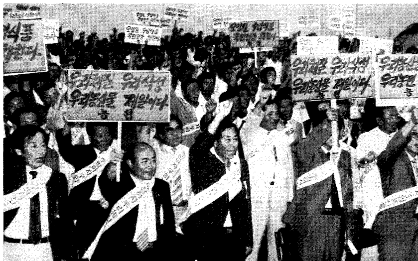
우리농산물 애용캠페인 전진대회('89. 8. 11)

농산물 대신 우리 농산물을 애용하는 한마음으로 뭉쳐질 때 우리 농민들은 불안감에서 벗어나 값싸고 신선한 우수농산물 생산에 전념할 수 있을 것이며 농촌경제의 활성화를 통해 농민과 농업, 농촌을 지켜 갈 수 있는 것이다.