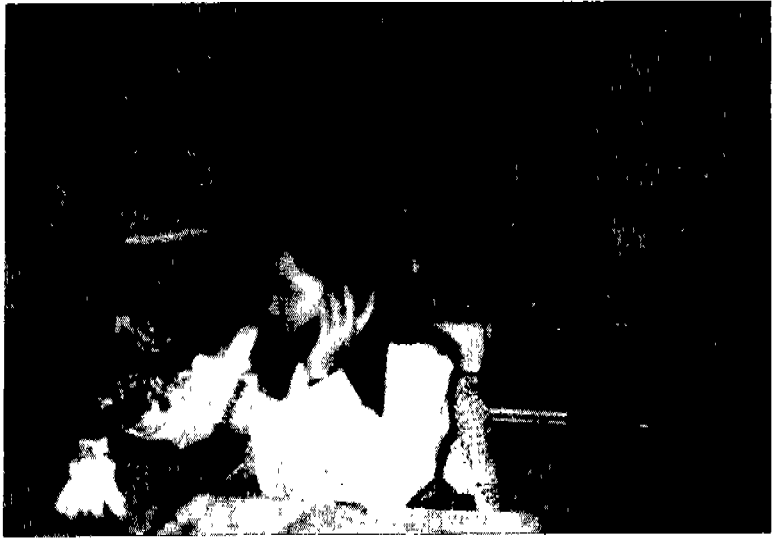
서울 남서지부사무실 전경 ▶ (좌 : 이순자 직원, 중 : 정수철 부지부장, 우 : 조명섭 지부장)