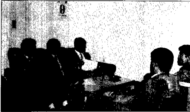
▲ 서울 남동지부장 및 운영위원과 함께한 필자(중앙)

해결하기 위해서는 더욱 더 단결할 필요성을 느끼며, 따라서 협회를 중심으로 전체회원이 화합을 이룰 수 있도록 집행부가 분발해 주었으면 하는 뜻으로 개인 사업의 이익을 버리고 공인으로서 봉사의 길을 걷고 있는 서울 3개 지부장의 설계를 들어본다.