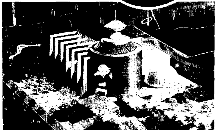
▲ 전기 에너지관