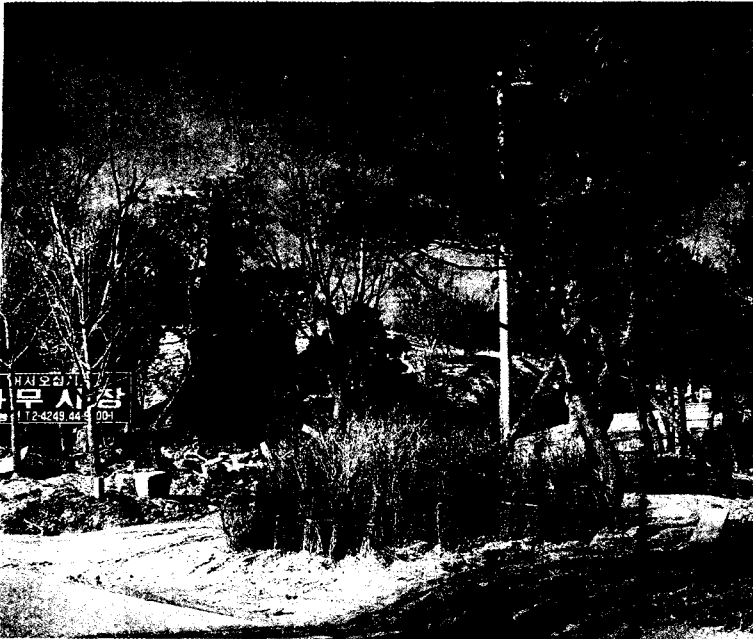
학계, 관계, 조경업계, 조경수생산자 등이 다같이 참여하여 가격을 결정하는 제도가 마련되면 현재 방식보다는 개선될 수 있을 것으로 생각된다.

인 수고, 수관폭, 흉고직경, 근원경, 지하고등만을 가지고 수목단가가 결정되고 유통이 이루어지기 때문에 수목품질은 거의 고려되지 않고 있다.