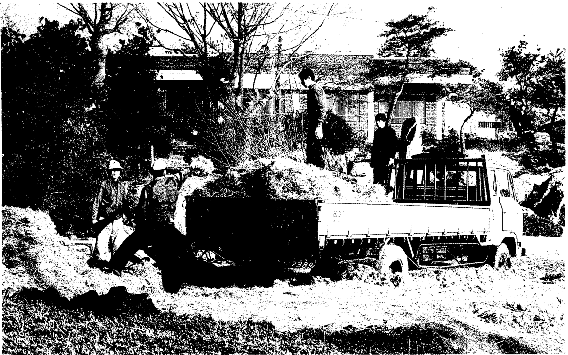
조경수의 유통은 많은 문제점이 있음에도 아직 그 대책도 마련치 못한 상황이다

째는 생산자-생산지조달 중간상인-소비지조달 중간상인-실 수요자의 경로이고, 마지막 유형은 생산자-소비지 중간상인-실수요자의 경로이다. 조경수목의 모든 유통경로가 이러한 기본적 유형대로만 유통되는 것이 아니고 실수요자와 중간상인의 과정에서는 여러가지 중간단계의 하청이 발생하여 1차 하청자, 2차 하청자, 3차 하청자까지를 통해 유통이 이루어지는 변형이 있기도 하다.