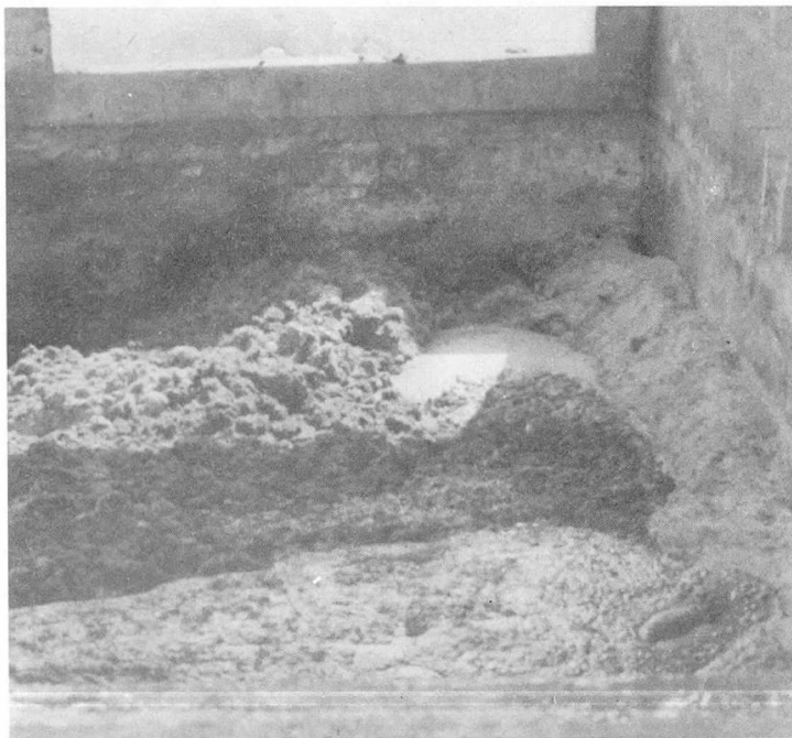
△ 발효돈사를 이용하지 않는 돼지의 분뇨는 별도로 이 장소에 모아 뚝밥과 섞어 발효시키고 있다.

발효돈사의 기본운영체계는 종래양돈의 기본운영체계와 별다른 것이 없으나, 가장 중요한 것은 구충이라고 한다. 벨엘농장은 지난해 구충문제, 특히 편충으로 경영위기를 맞기도 했었다. 따라서 과거 자돈때 한 번만 구충하면되었던 것을 지금은 비육돈으로 발효돈사에 옮길