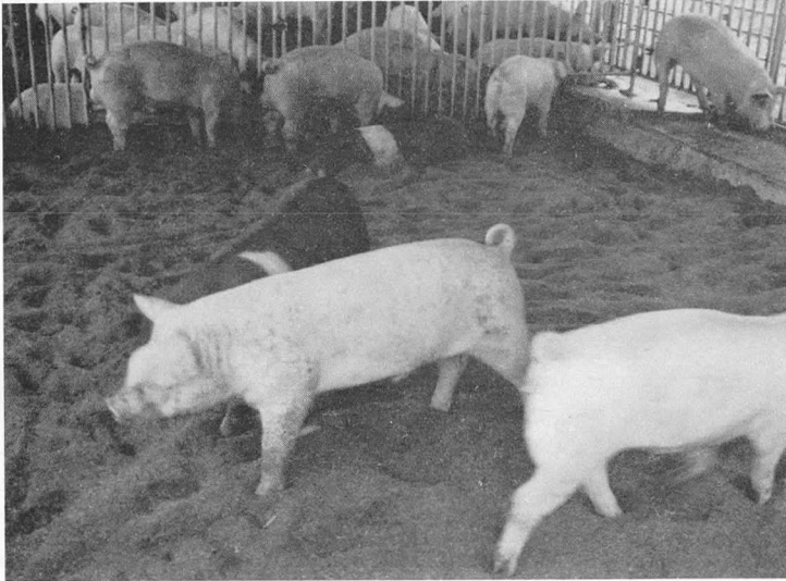
△ 톱밥발효돈사 내부

다. 현재 모돈 200두, 후보돈 20~30두, 자돈 300~400두, 비육돈 1,400두 등 총 2,000여두를 사육하고 있다. 벨엘농장은 비육돈사와 대기사 700여평에 톱밥발효돈사를 설치해 이곳에 1,500두의 돼지를 기르고 있다. 직원은 사장을 포함해 모두 5명이다.