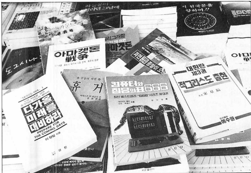
인류종말을 예고하는 각종 도서들이 서점가를 장식하고 있다.

비롯한 아랍권과 미국·유럽·아시아를 망라한 다국적이 개입된 '세계대전'의 성격)을 강조하고 있다.