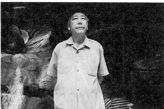
▲ 영국사 산중폭포에 선 필자