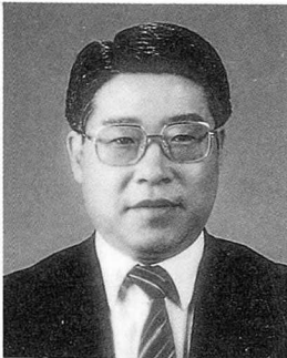
이 해 관