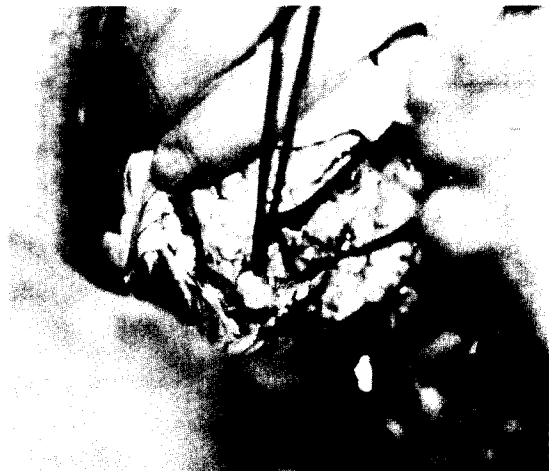
Fig. 3. Operative field ;Grossly, the aneurysm was covered with epicardial fat tissue. Its diameter was 2 \times 2 \times 1.5 cm with 0.5cm in neck. Aneurysmal wall was very thin and inner surface was smooth.