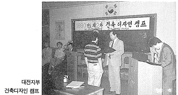
대전지부 건축디자인 캠프