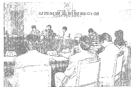
경남지부 신입회원 오리엔테이션

내 회원, 창원시 건축관계관 등이 참석한 가운데 지난 23일 거행되어 업무에 들어갔다.