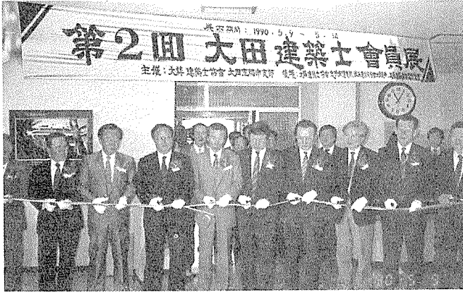
대전지부 제2회 회원작품전