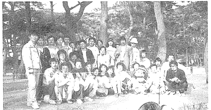
전남지부 보조원 친선체육대회

지난 5월12일 섬진강변 백사장에서 개최된 이날 체육대회는 관내 보조원 43명이 참가, 육상과 족구 기량을 겨루는 한편 상호 유대를 돈독히 하였다.