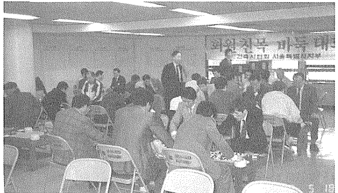
서울지부 회원친목 바둑대회