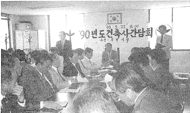
경기지부 간담회 개최

공간에서 개최되었다. 지난해에 이어 두번째 개최된 이번 전시회는 연인원 1천9백여 명이 관람하여 대전지역 건축계의 큰 주목을 받았다.