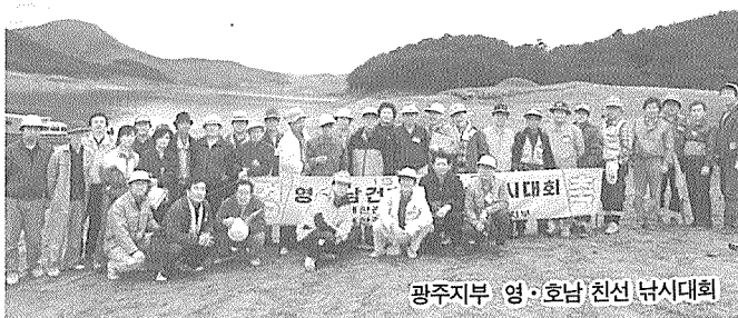
광주지부 영·호남 친선낙시대회

경제적 부담을 덜어주고 지역발전을 위한 이 지방 인재양성의 요람이될 남도학숙건립기금 1백만원을 전달하였다.