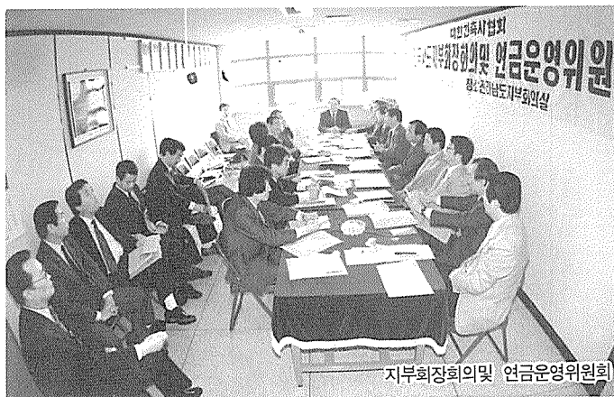
지부회장회의 및 연금운영위원회

이날 회의를 마친 후 참석자들은 도지사를 방문하고 인근 산업시설을 시찰하였으며 지부에서 마련한 기념품 증정도 있었다.