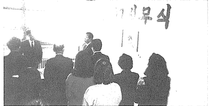
전남지부 사무식 및 직원직무교육