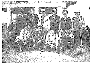
경북지부 회원친목 등산대회

에서 애정, 진실, 화합분위기 조성을 위한 친교행사 및 간담회를 개최하였다.