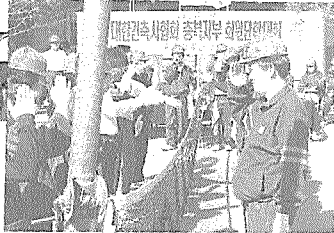
충북지부 회원친목 단합대회