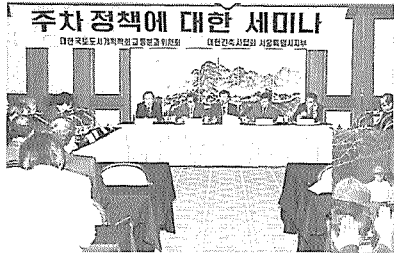
서울지부 주차정책에 대한 세미나