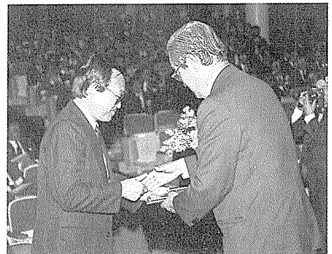
공로패 및 감사패 전달광경