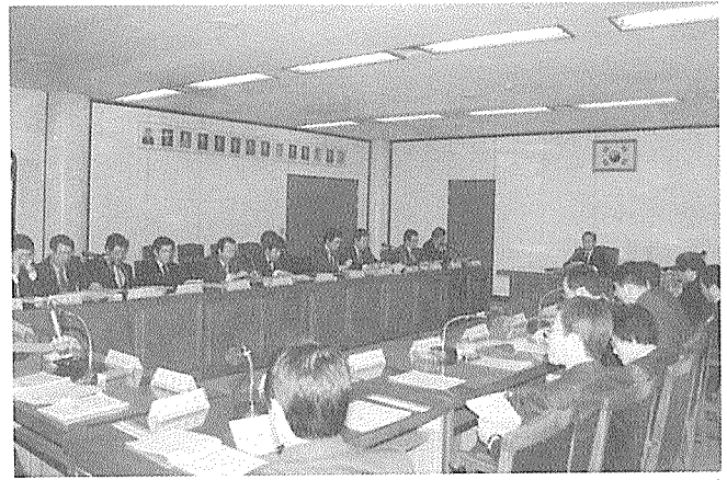
전국 시도지부 회장회의

- 예비비사용 요청액중 임원의 총회 참석여부는 삭제하고 대의원의 총회참석여비지급을 위한 예비비 사용을 승인함