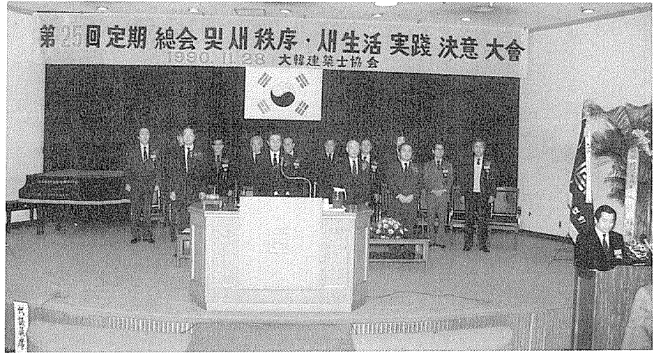
제25회 정기총회는 새질서, 새생활 실천결의대회를 겸했다. (결의문 채택 광경)