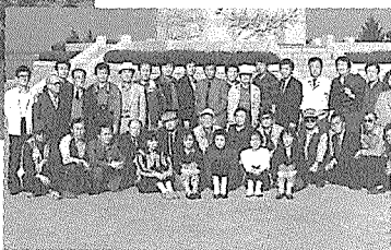
전남지부 회원친목 단합대회