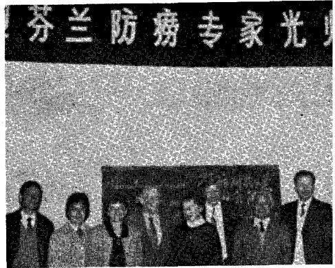
베이징을 방문한 핀란드 항결핵협회 대표단