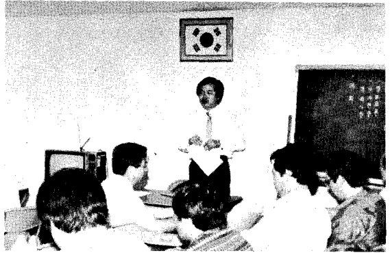
△ 채란분과위원회 양계장 청결문제 세미나