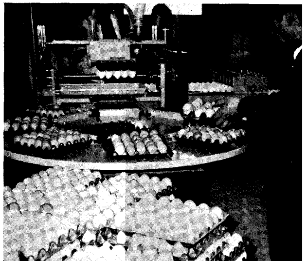
△계란의 상품성을 높이기 위해 유통계란은 반드시 GP 처리를 해야만 한다.

미국에서는 계란의 소비촉진을 위한 일반수요 창출활동을 미국 계란 촉진회(American Egg Board)가 전담해서 관장하고 있다. 이 기구는 1976년에 미국의 회를 통과하여 법적으로 제도화된 자조금을 운영하여 계란에 대한 연구 및 소비촉진사업을 실시하는 조직이며 자조금은 모든 계란생산자가 자신이 속해 있는 산업발전을 위해 계란판매시 의무적으로 360개가들이 상자당 2.5센트(계란 100개에 5원)씩 내게 되어