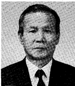
진 교 복 복일농장

1990년 우리나라 육우산업을 전망하기는 대단히 어렵다. 최근 국제통상상의 상황으로 볼 때 또한 우리나라 정부의 통상 정책의 의지로 볼 때 불투명하면서도 어둡다는 느낌을 받을 수밖에 없다.