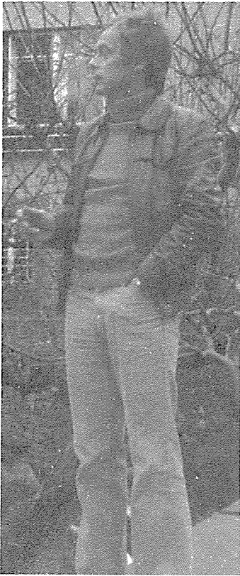
▲ 에르노 루빅

루빅 큐브생산을 하기로 했고, 첫번째 제품이 선보인 것은 그 해가 저물어 갈 무렵이었다.