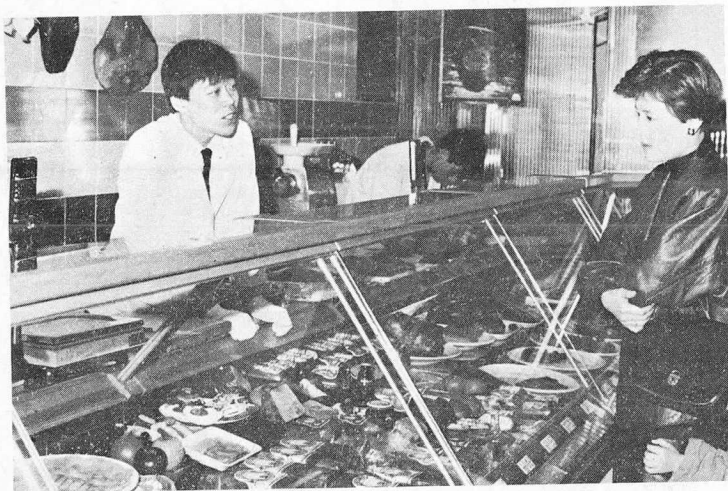
▲ 육제품을 사러 온 주부에게 제품의 특성과 조리방법을 설명하고 있는 「마이스터·델리」직원