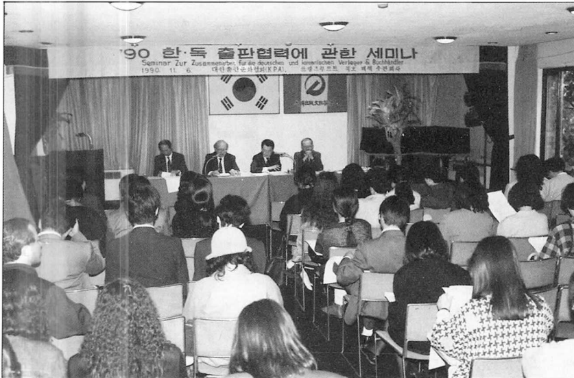
지난 6일 출판협회 강당에서 개최됐던 '90 한국-독 출판협력 세미나' 전경.

그의 일부 출판사는 자체 도서유통체계를 스스로 조직해 책을 배달하기도 한다. 결국 독일 도서유통시스템의 가장 큰 장점은 신속하고 정확한 배본, 그리고 외국의 경우에 비해 조직화가 잘된 점이라고 생각한다.