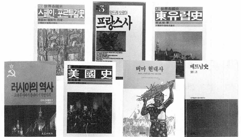
서점에 나와 있는 세계각국사 연구서들. 번역물이 대부분인 가운데 국내저술도 점차 늘고 있다.

국내연구자에 의한 각국사의 연구성과는 앞서 지적했듯이 일천한 상태라 할 수 있다. 이와 같은 현실 속에서 일관된 편집방침 아래