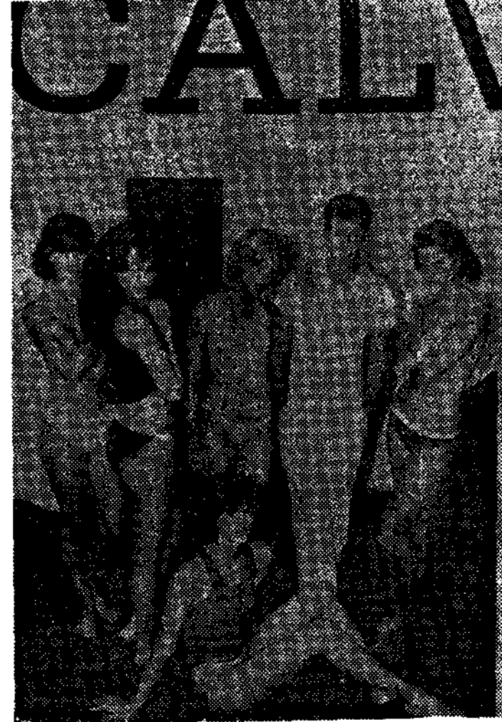
〈그림7〉 Calvin과 underwear 광고 사진

갖춘 여성미를 위한 유연성을 표현하면서, Blue-Jean은 Puritan Fashion Co.에 Licensee를 주어, 보다 저렴한 가격과 $5 million을 투자 Brook Shield를 모델로, Calvin이 직접 제작한 광고 효과가 성공을 거두어, Jeans Market만도 미국에서 $600 million의 매출을 올리게 되었다.