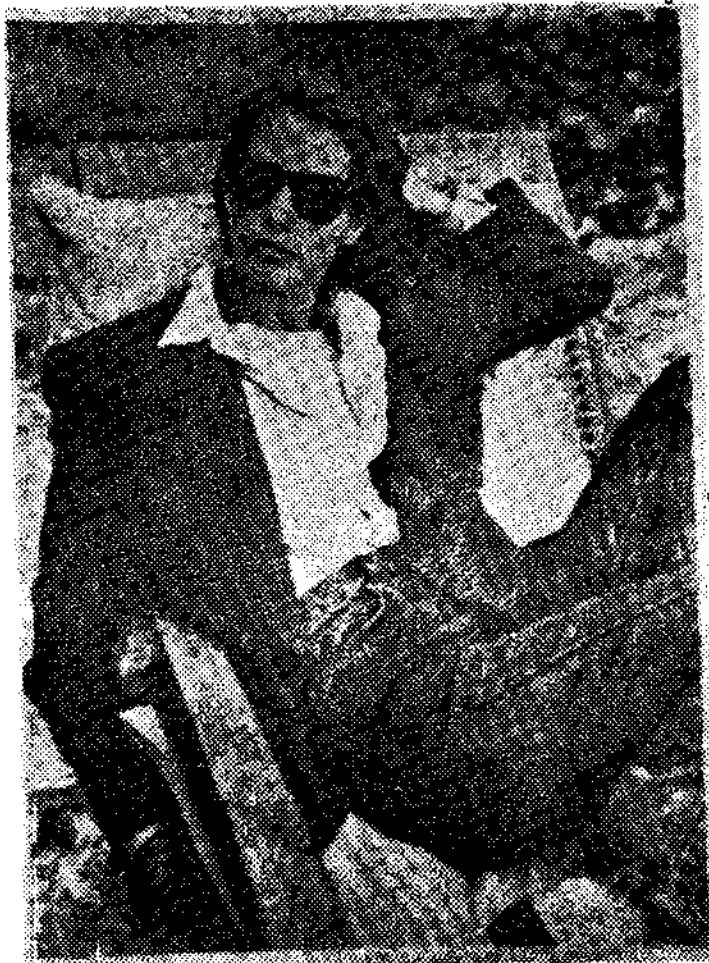
<그림8> Calvin Klein의 Blue Jean과 그의 Sporty style