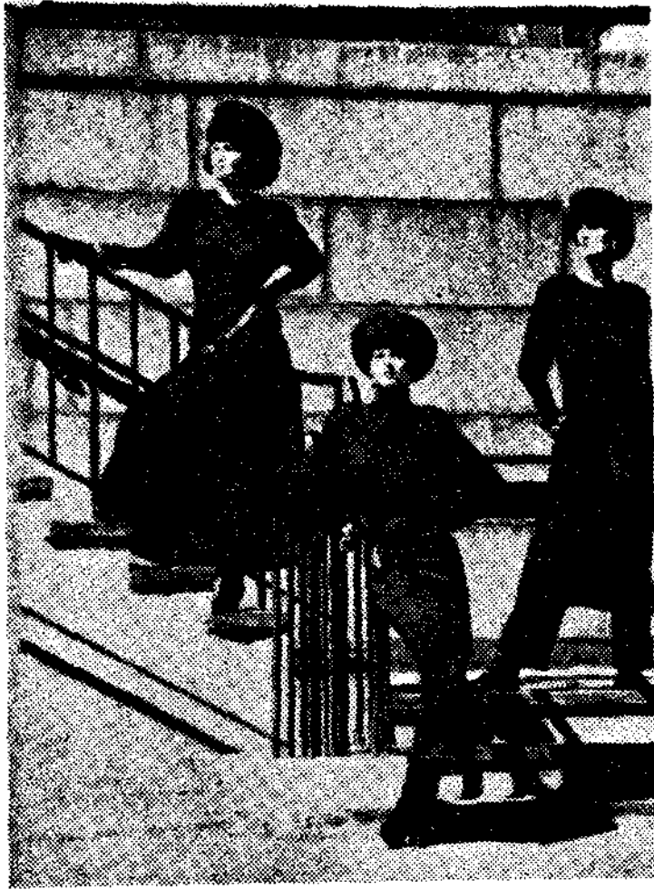
〈그림 12〉 Donna Karan의 1985년 첫 Collection line중에서