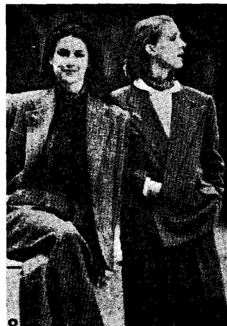
<그림10> '80s 초기의 의상으로 Ralph Lauren의 Men's wear 풍의 suits and pants.

1967년 Bean Brummel사에서 넥타이 디자인을 "Polo"라는 이름아래 넓은 넥타이를 만들었는데, 이것은 넥타이의 Label boom을 일으킴과 동시에 넥타이 디자이너로는 상징적인 존재가 되었다. 1년후인 1968년 "Polo by Ralph Lauren"으로 독립, 남상복을 시작하였고, 71년 남성복의 Idea를 여성복으로 옮겨 Man-tailored shirts, Shetland sweater, Walking shorts, Pants, Trench-coat등 가정과 직장, 도시와 교외에서 겸용할 수 있는 Classic, Sporty, Western culture를 느끼게 하는 Country풍의 line를 전개, 45) 장식적이고 기교적인 Paris Mode에