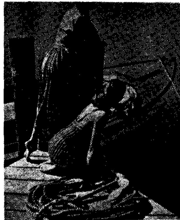
〈그림4〉 1947년 Harper's Bazaar에 실린 McCardell의 Shirtwaist Sundress.

1956년 "What shall I wear?"란 책을 발표, 그녀의 글 속에서 「디자이너는 자기가 가장 좋아하는