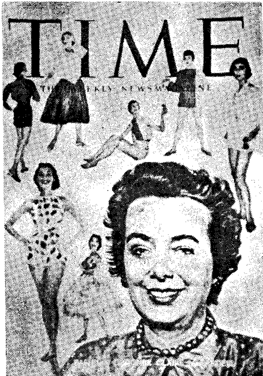
<그림5> 1955. 5의 'Time'지 표지 Claire McCardell의 소개

패션 디자이너로는 처음으로 1955년, Time지가 표지모델(Cover personalities)로 채택, 그녀의 옷과 작품 세계를 자세히 묘사하고 그녀가 미국 패션산업에 미친 영향과 업적을 극찬하기도 했다. 34) (그림 5)