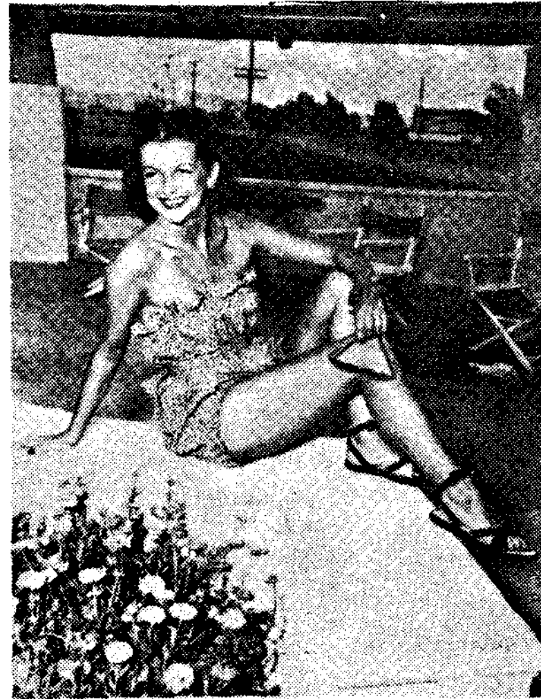
<그림6> baby McCardell의 Bubble look의 수영복이자 Playsuit

그녀는 그동안 패션을 主導해 왔던 Paris Mode가 弱化되어 있고 미국으로 패션이 옮겨지던 전쟁시기에 미국 방식에 맞는 자유로움을 옷에 과감히 도입, 옷이 主가 되기 보다는 이를 사용한 人體가 主가 되어 人體와 옷이 조화되도록 하였다. 이런 유연성과 편안함, 자연미를 주는 그녀의 의상은