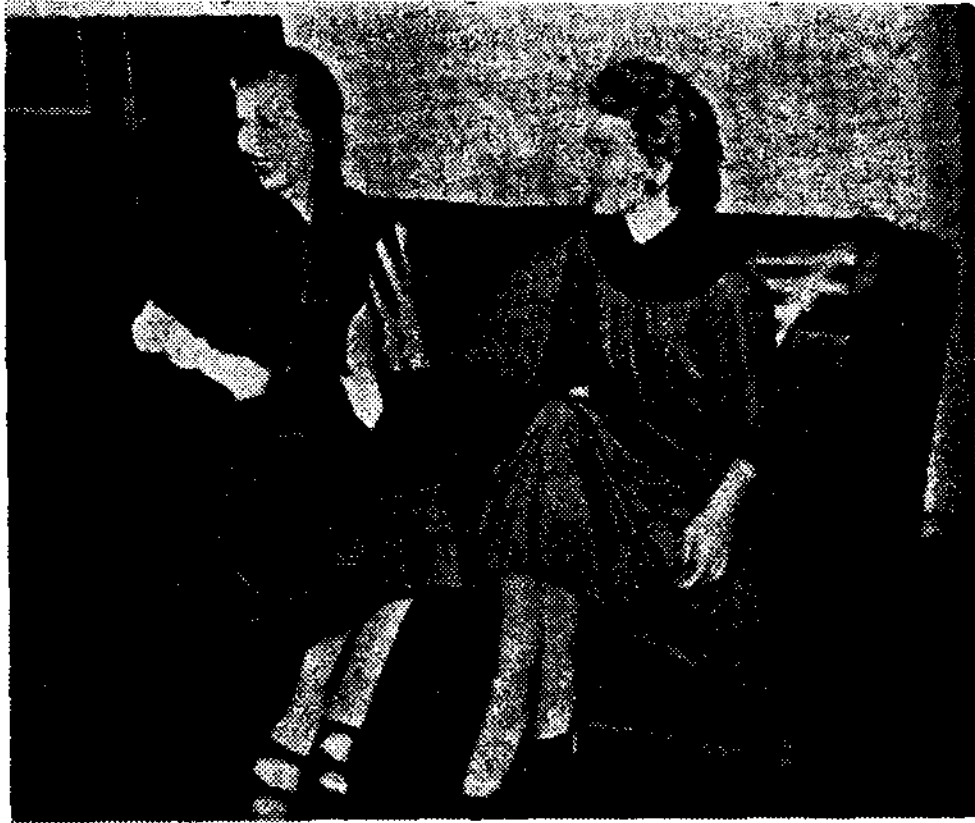
〈그림2〉 1938년 선보인 Claire McCardell의 'Monastic Dress' 로 검정 벨벳요크에 주름이 풍성히 잡혀, 허리로 Size 조절하도록 하였다.