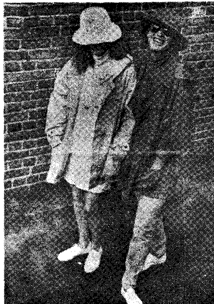
〈그림 15〉 Donna의 1988년 출하된 'DKNY' line 중에서

1988년 DKNY(Donna Karan New York)란 상표로 주말에 casual하게 입을 수 있는 의상, 저렴한 가격으로 Donna Karan Image를 살 수 있는 의상으로 Denim, Cotton, Poly blends를 이용, T-shirts, Jacket, Jumper-suit, Skirts, Pants등으로 분리(seperated)된 American Style의 Sportswear로 주말의 Leisure wear를 발표, 53) 이것은 Anne Klein II와 같은 빠른 성공을 거두고 있다(그림 15, 16).