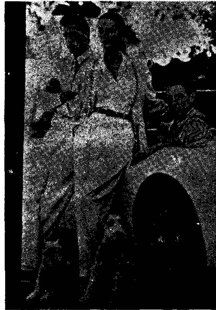
〈그림11〉 '80s 중반기의 Lauren의 귀족풍이 풍기는 우아한 Sportswear.

T.W.A Uniform등을 제작, Sports를 위한 의상, Sporty한 의상을 전통적인 귀족풍의 Classical formal & casual로 時空間을 초월, 모든사람이 공감대를 형성할 수 있는 독특한 세계를 창조해가고 있다(그림11).