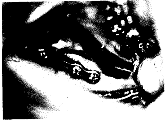
그림 1. 시상골 골절단술후 절단 부위를 miniplate를 사용하여 고정시킨 모습.

screw tightening을 위해 screw-holding screw dri-