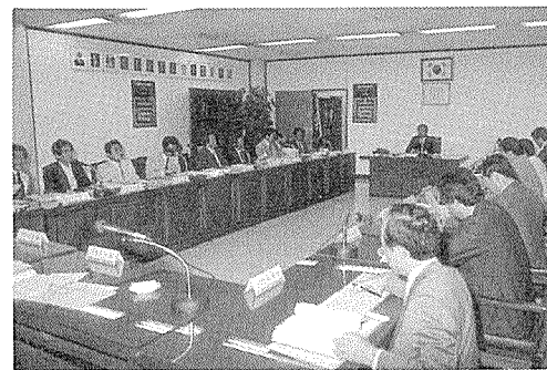
제5회 지부회장 회의