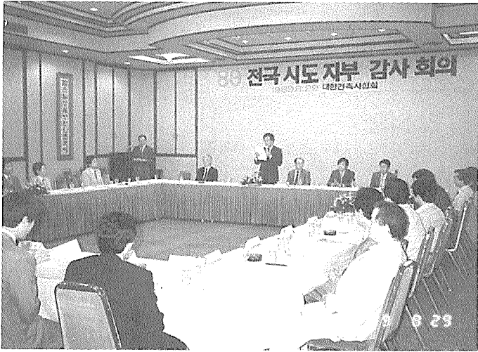
대전 유성관광호텔에서 개최된 전국시도지부 감사회의