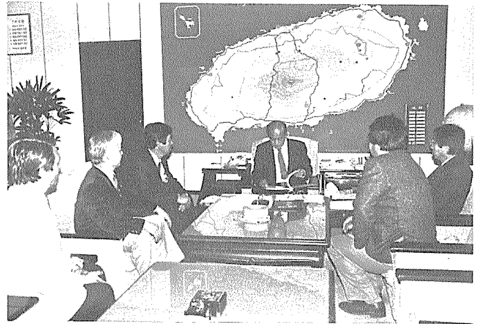
▲ 濟州道知事를 예방하고 환담하는 지부 임원들