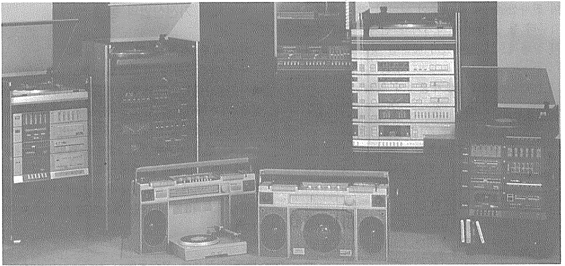
“한국의 가전산업”에서 “세계 속의 가전산업”으로 성장해야 한다.