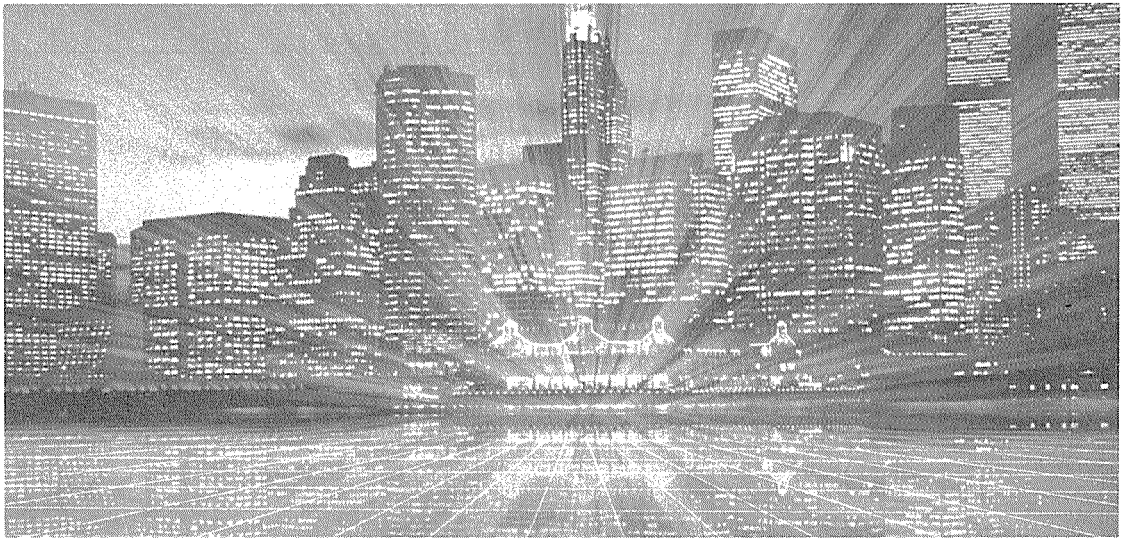
금후 세계 경제에 대한 역할 분담 문제가 제기될 것이다.

義의 팽배 등은 國際經濟의 불균형 해소를 어렵게 하고 나아가 세계경제의 전망을 불투명하게 하고 있는데 특히 아시아 新興工業國(NICS)을 대상으로한 차별적 무역조치는 자칫 이들 국가의 세계경제에 대한 기여를 저해하고 先進國의 物價上昇을 가져올 가능성도 높다고 하겠다. 여기서 세계경제가 당면하고 있는 정책과제와 구조적인 문제점을 지적해 보면 다음과 같다.