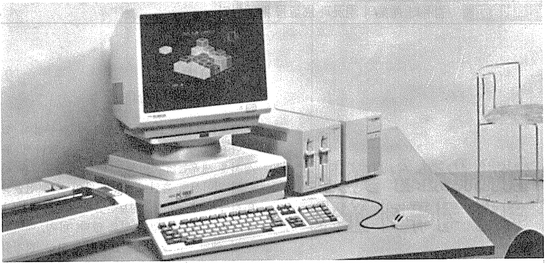
소프트웨어 산업, 정보처리 산업, 정보제공 산업은 필연적인 동반관계에 틀림없다

이 비례적으로 컴퓨터 산업을 진흥하게 된다. 그러므로 어느 하나를 발전시킴으로써 다른 분야도 저절로 발전할 것으로 기대하여서는 아무런 성과를 기대할 수가 없다. 이러한 지원을 위해서는 우선 이를 관장하는 정부기관의 관장사항을 재정립하여야 할 것이다. 다시 말하면 지금까지의 분류체계와는 다른 부처별 소관업무를 가지고 있다. 예를 들면 정보산업 전반은 상공부의 소관사항으로 알려져 있으나 “기술개발”은 과학기술처 소관으로 되어 있으며 정보통신 분야는 체신부가 관장하고 있다. 이것이 경우에 따라서는 중복된 관장이 있는가 하면 많은 부문은 제외되고 있는 형편이다.